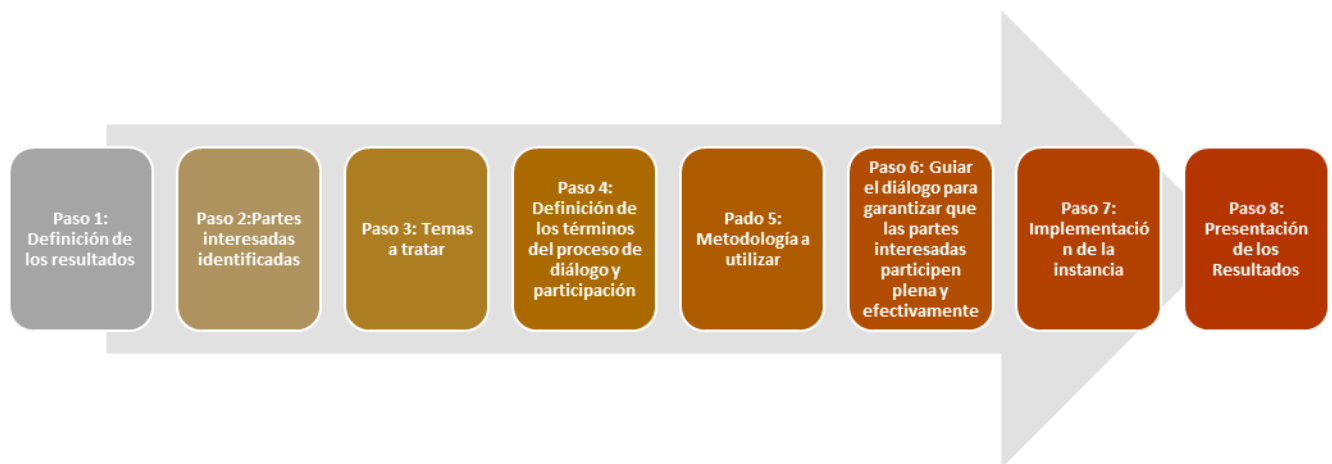
Figura 2. Los ocho pasos de FCPF para el involucramiento de las partes interesadas.

A continuación, se presenta el desarrollo metodológico de los 8 pasos para el proceso de diálogo y participación de la Estrategia REDD+ Guatemala: