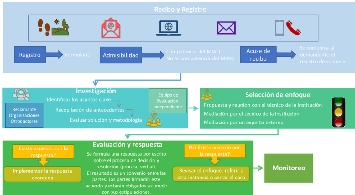
Figura 3. Procedimientos de atención de solicitudes de información y quejas

El MIAQ será socializado a las partes interesadas en la fase de consolidación de la Estrategia, específicamente en la segunda ronda de diálogo y participación. Se espera contar con un MIAQ funcionando para la fase de implementación de la Estrategia.