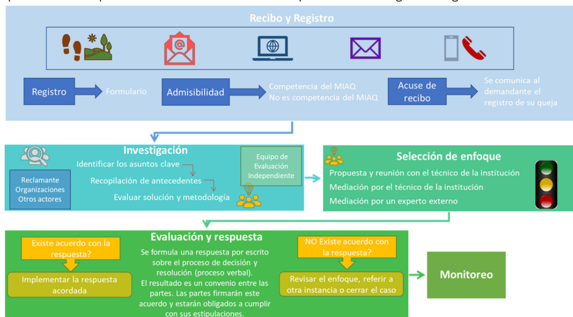
Figura 3. Procedimientos de atención de solicitudes de información y quejas

El procedimiento para la atención de solicitudes se presenta en la siguiente figura: