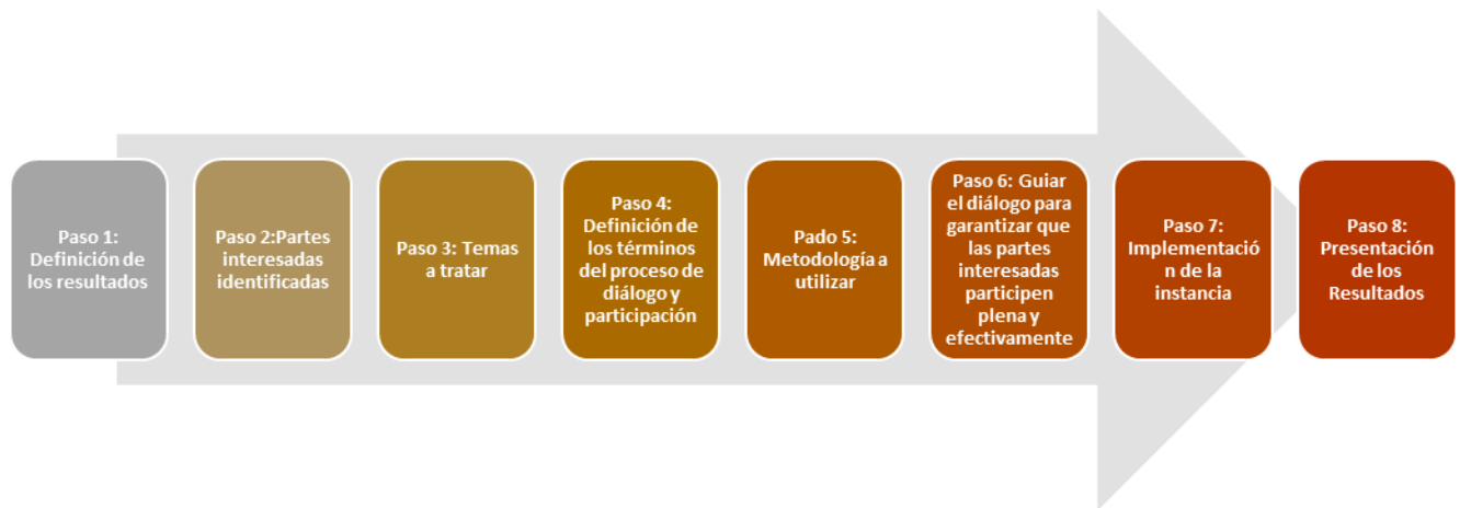
Figura 2. Los ocho pasos de FCPF para el involucramiento de las partes interesadas.

A continuación, se presenta el desarrollo metodológico de los 8 pasos para el proceso de diálogo y participación de la Estrategia REDD+ Guatemala: