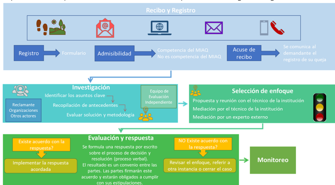
Figura 3. Procedimientos de atención de solicitudes de información y quejas

El procedimiento para la atención de solicitudes se presenta en la siguiente figura: