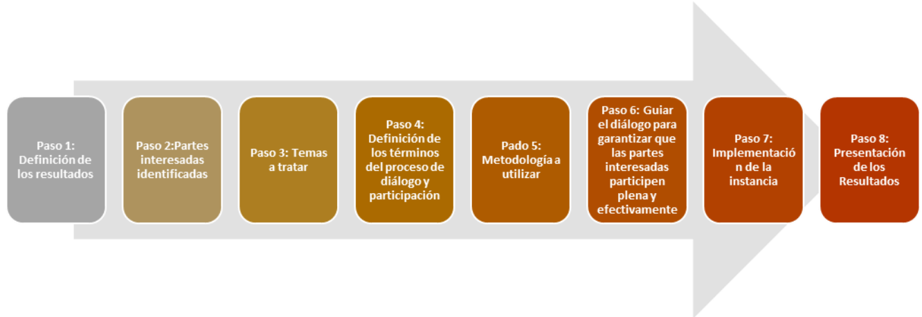
Figura 2. Los ocho pasos de FCPF para el involucramiento de las partes interesadas.

A continuación, se presenta el desarrollo metodológico de los 8 pasos para el proceso de diálogo y participación de la Estrategia REDD+ Guatemala: