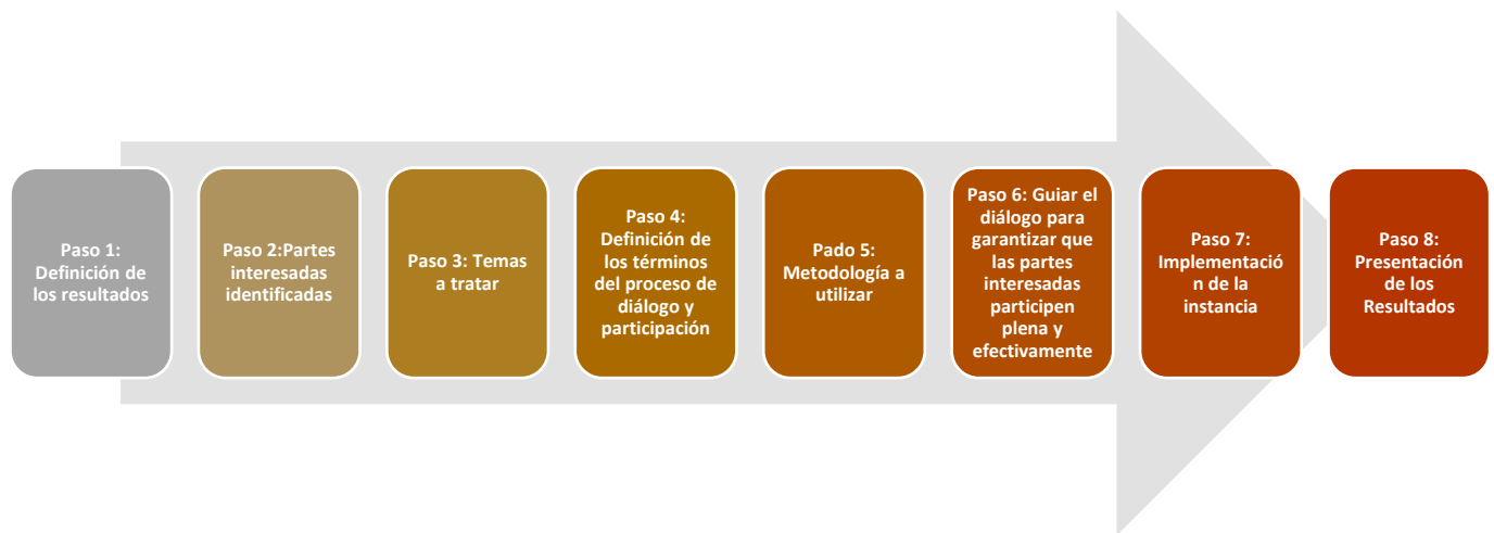
Figura 2. Los ocho pasos de FCPF para el involucramiento de las Partes Interesadas.