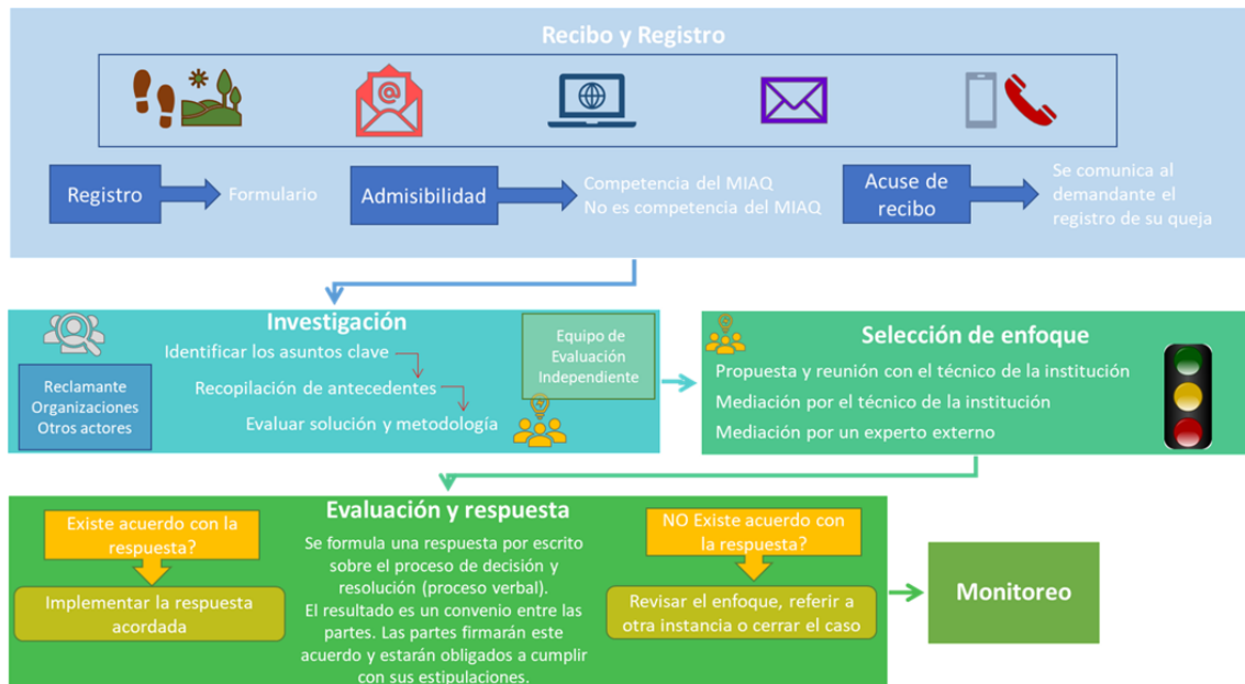
Figura 3. Procedimientos de atención de solicitudes de información y quejas

El procedimiento para la atención de solicitudes se presenta en la siguiente figura: