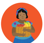
Productos del bosque