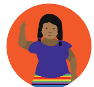
Tomas de decisión